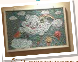
障害者福祉施設で制作された作品が飾られています