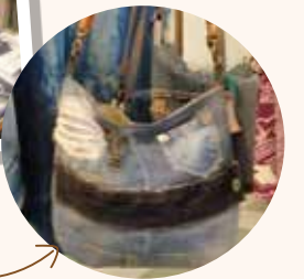
ジーンズ地をリメイクしたバッグ