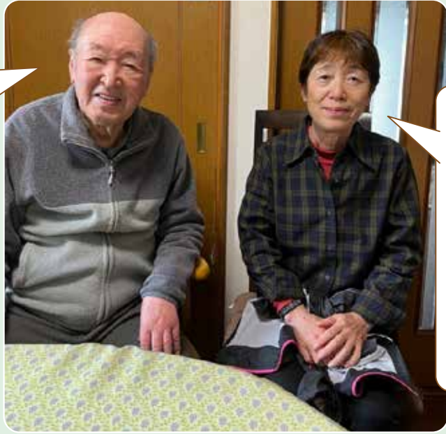
※撮影の為マスクを外していただいています

最初お会いした時に、18年前に亡くなった父を思い出しました。掃除の前後に、戦前の生活の様子や教員時代のほのぼのとした学校の出来事など貴重なお話をしてくださいませ。博識でいつも穏やかな方です。これからも楽しく支援を続けていきたいと思っています。