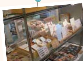
定番人気の紙製品