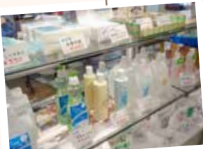
姉妹都市佐久穂町から仕入れた商品