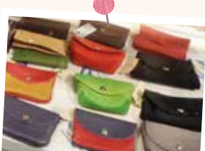
可愛らしい革製品