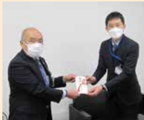
(府中女性防火の会)