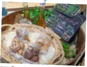
手作りクッキーや食品