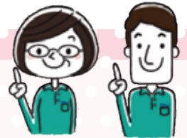
府中市地域福祉 コーディネーター