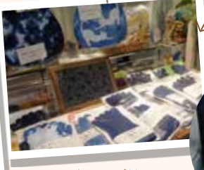
爽やかなこの季節は藍染めが人気♪