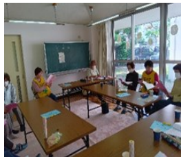
サロンの手伝い・話し相手