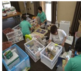
食品の仕分け作業