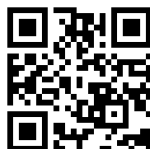
社協ホームページ