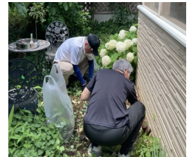
ちょこっとお手伝い